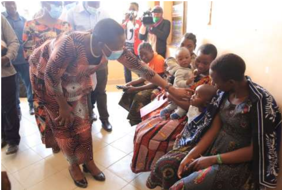
Waziri wa afya jinsia maendeleo ya jamii wazee na Watoto akimsalimu mtoto ambaye amefika na mama yake katika zahanati ya sukamahela ili kupata matibabu.