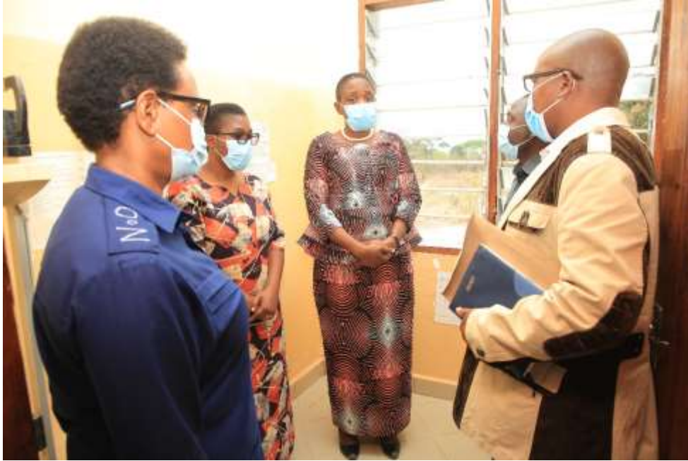
Waziri wa Afya Doroth Gwajima Akijidhirisha na dawa zitolewazo na Zahanati ya Kijiji cha Sukamahela na kuwapongeza viongozi kwa namna wanavyojali Afya za wazee