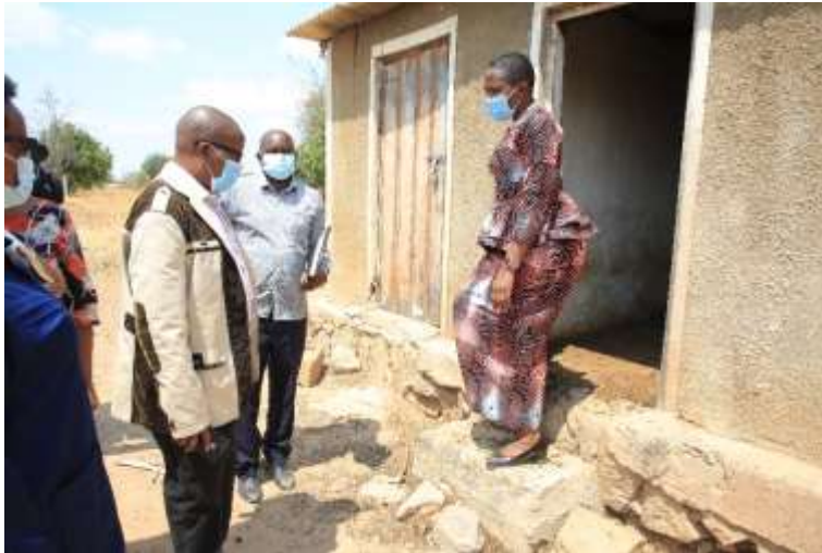
Mh Waziri akikagua zizi la mbuzi ambao ni mradi unaoendelezwa na kikundi cha mapambuzuko kinachohudumia wazee Sukamahela